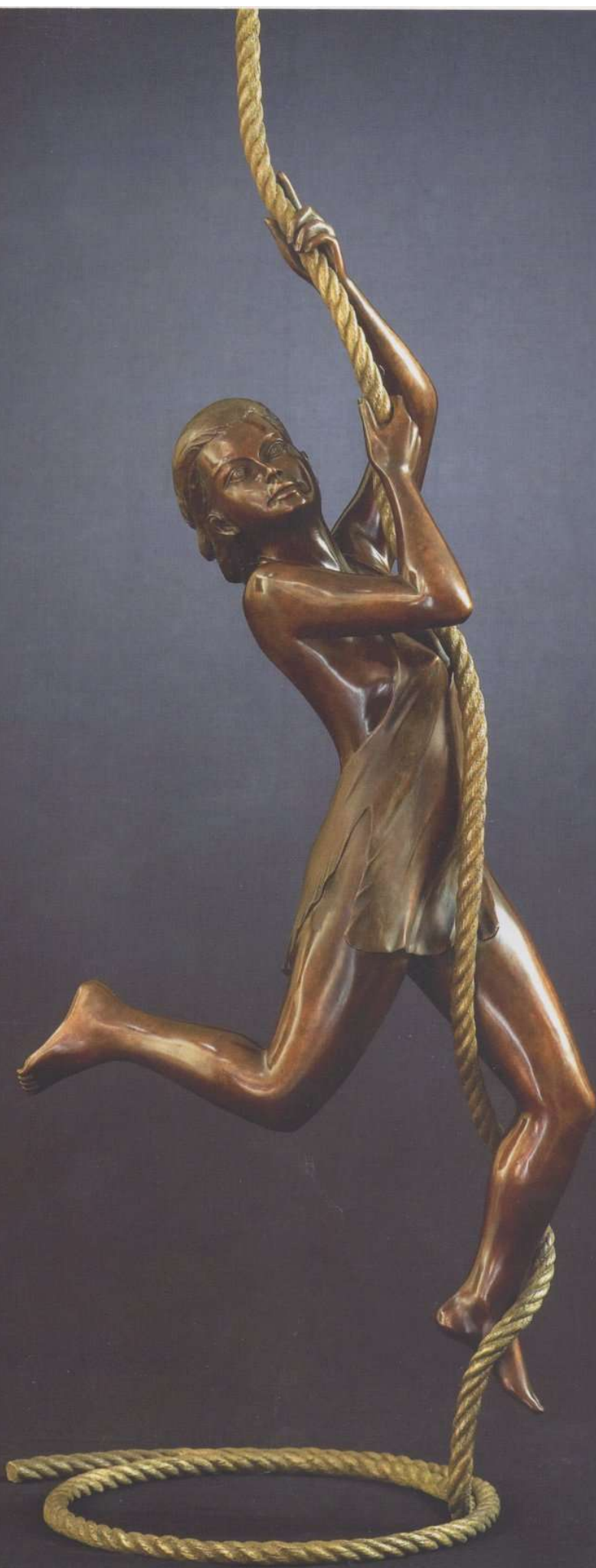
"Liberté", Bronze original, H : 92 cm