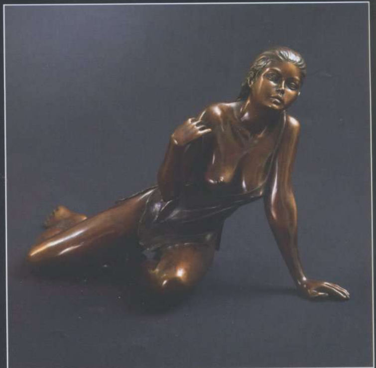
"Sensualité", Bronze original, L : 55 cm

En permanence : Atelier-Galerie 56, rue du Jerzual 22100 Dinan - Tel. 02.96.85.27.58