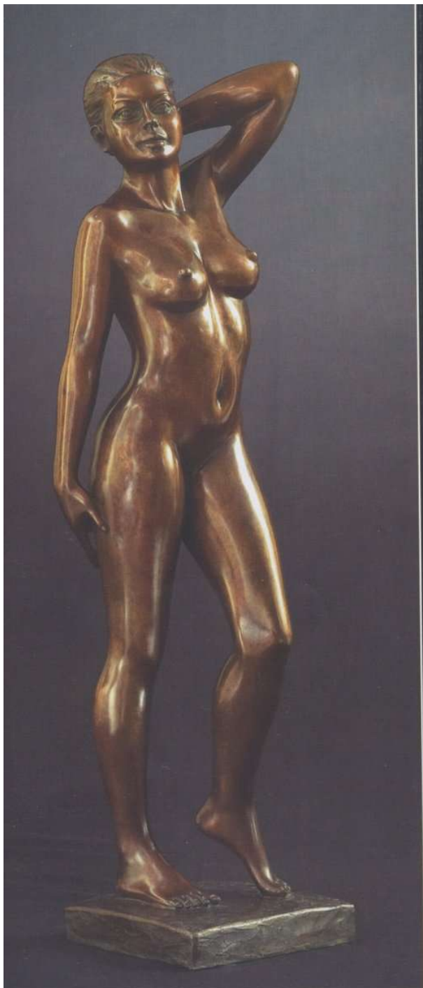
"Le regard", Bronze original, H : 62 cm

s'orienter vers une autre technique : il choisit alors le bronze pour sa puissance évocatrice.